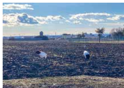
北海道池田町にて