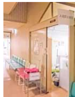
入退院支援室入口

医療処置の指導や精神面を支援し、患者様が必要とする情報を得られるように、院内外の医療スタッフとの連携を大切にしています。