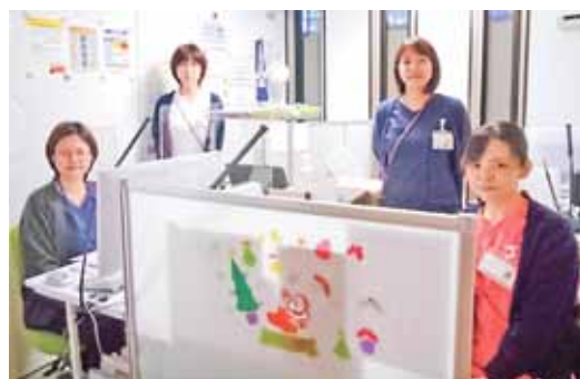
(撮影時のみマスクを外しています)