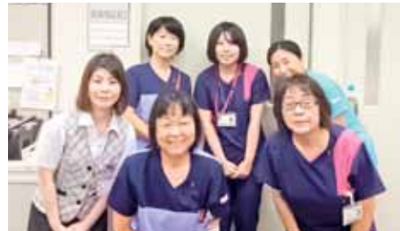
（撮影時のみマスクを外しています）

相談員5名が患者さんやご家族、地域住民の皆さんからの相談を受け支援を行っています。相談員は全員、国家資格を持つソーシャルワーカー（社会福祉士、精神保健福祉士）や看護師です。困りごとがありましたら、お気軽にご相談ください。また、地域包括ケアシステムの中核機関として専門職や地域住民を対象とした各種研修会や交流会を企画しています。（新型コロナウイルス感染拡大防止のため最近ではZoomを活用）