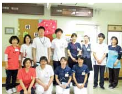
(写真撮影時のみマスクを外しております)

私たちは、患者・家族様が安心して地域で暮らせるようにこれからも支援していきたいと考えています。