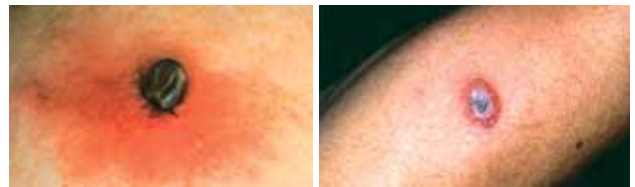
講談社 皮膚科診断治療大系1より抜粋