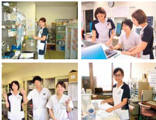
若手スタッフが育っています

そのため私たちの病棟で過ごされる期間は限られ、短い入院期間となりますが、「笑顔で心のこもった看護」を実践したいと思っています。