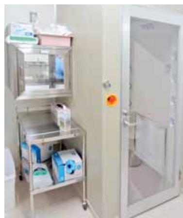
無菌室 (エアシャワー・パスボックス)

この他にも、薬品の品質や在庫の管理や抗生物質の治療では薬物の適正な血中濃度管理の相談を行うことなど薬の専門家として様々な仕事を担っています。