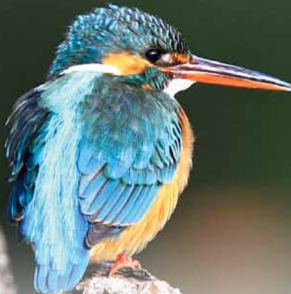
『カワセミ』