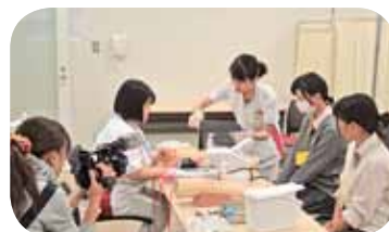
採血体験 (ケーブルテレビからの取材もありました)