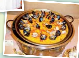
やっぱりパエリア!