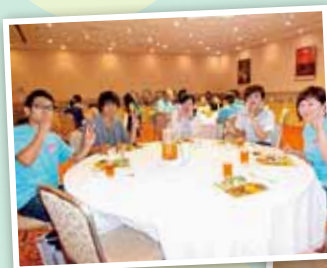
ランチでさらに話が弾む