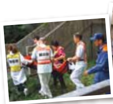
患者様避難誘導訓練

今後も、患者様及び来院者の皆様の安全を守るため、職員一同頑張りますので、皆様方のご協力、よろしくお願いします。