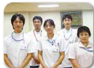
リハビリテーション室のスタッフ

不十分な点はたくさんあると思いますが、病気やケガをきっかけとして低下してしまった関節や運動機能を、少しでも回復させる御手伝いができるように頑張っていきたいと思っております。