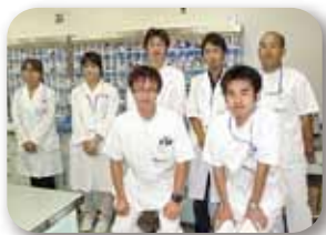
薬剤師のスタッフ