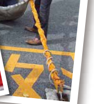
斜降式救助袋による訓練