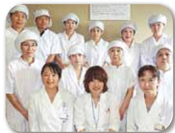
栄養室のスタッフ